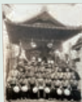
昭和9年 竹町中町会の有志により購入した下谷神社お神輿のお披露目