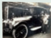
大正10年頃 まだ珍しかった自動車をチャーターしてお宮参りへ